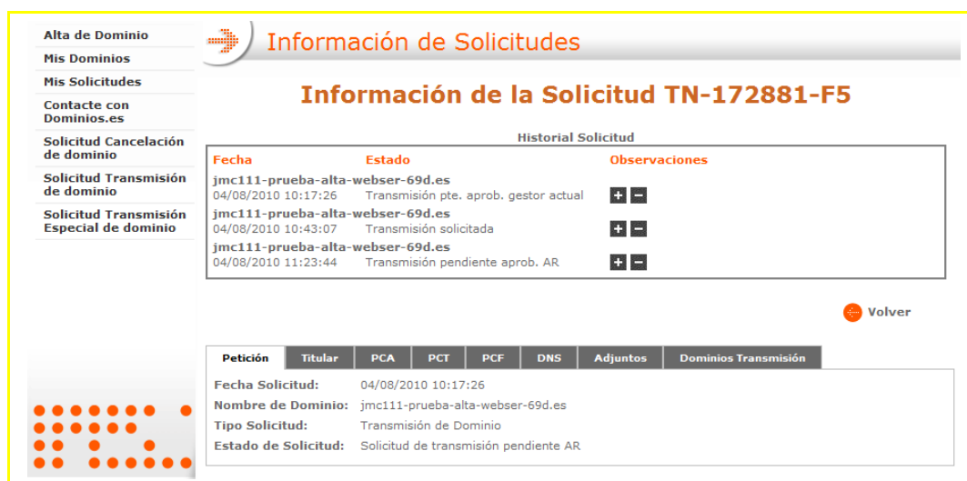
Imagen 11 – Detalle solicitud de transmisión