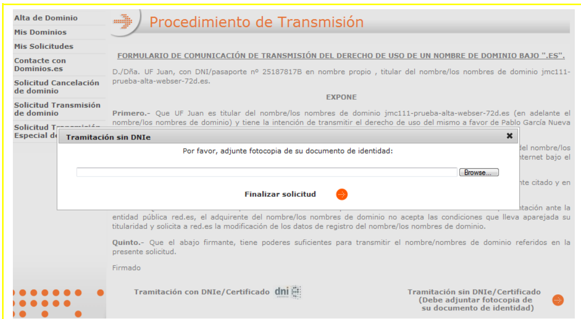
Imagen 5– Firma documento transmisión mediante fotocopia

Deberá pulsarse el botón “Tramitación sin DNIe/Certificado”, la aplicación mostrará una pantalla donde podrá seleccionar un fichero a adjuntar.