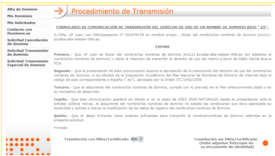
Imagen 3– Detalle documento solicitud transmisión

Una vez aceptada la solicitud de transmisión, la aplicación le mostrará el contenido de la petición para que compruebe los datos introducido y proceder a firmar el mismo de 2 posibles formas: