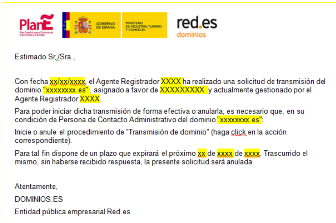
Imagen 1– Correo confirmación transmisión titular actual

Cuando el Agente Registrador lanza una petición de transmisión el titular o PCA asociado (dependiendo de la suplantación que se indique en el formulario de solicitud) recibe el siguiente correo electrónico en el que puede confirmar o cancelar la solicitud de transmisión.