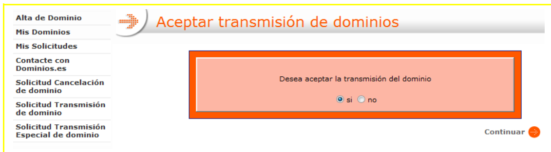
Imagen 8 – Aceptación/Denegación solicitud transmisión dominio por nuevo PCA

Mediante los links del correo electrónico el usuario podrá confirmar o rechazar la transmisión.