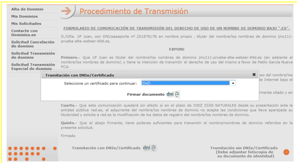
Imagen 4– Firma documento transmisión mediante DNIe

Un vez concluida la firma del documento se pulsará “Firmar solicitud” para finalizar.